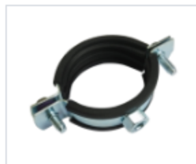
S-ХОМУТ С ГАЙКОЙ

Материал сталь Покрытие цинк белый Область применения для инженерных коммуникаций , для строительства Диаметр, мм 36-39 -149-161