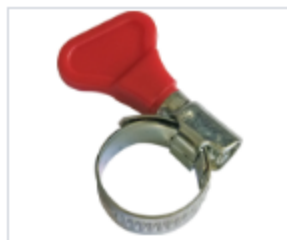
ЗАТЯЖНОЙ ХОМУТ С КЛЮЧОМ

Материал сталь / нержавеющая сталь A2 Группа крепежа нержавеющий крепеж Область применения для авторемонта , для инженерных коммуникаций , для строительства Диаметр, мм 8-12 -190-210