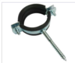
S-ХОМУТ С ШУРУПОМ

Материал сталь Покрытие цинк белый Модель (марка) S-Хомут Область применения для инженерных коммуникаций , для строительства