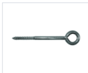
АНКЕР ДЛЯ СТРОИТЕЛЬНЫХ ЛЕСОВ