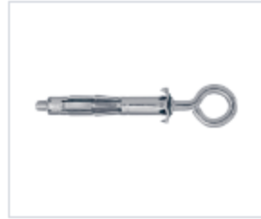
ДЮБЕЛЬ MOLLY С КОЛЬЦОМ

Материал сталь Покрытие цинк белый Модель MOLLY (марка) Шлиц комбинированный (PH+PL)