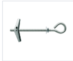
АНКЕР ETAf С КОЛЬЦОМ

Материал сталь Покрытие цинк белый Модель ETAf (марка) Головка открытое кольцо