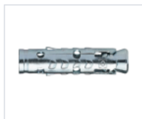
АНКЕР LE С КОЖУХОМ