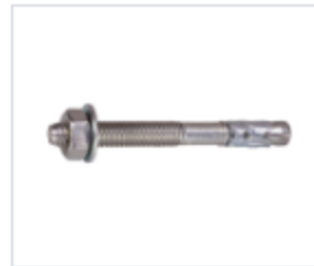
АНКЕР FIX II (СОБРАННЫЙ)

Материал сталь Покрытие цинк белый Модель (марка) FIX II Тип резьбы метрическая