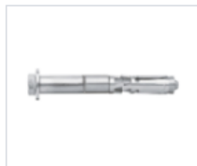
АНКЕР TRIGA Z C БОЛТОМ

Материал нержавеющая сталь A2 Модель ETKD (марка) Тип резьбы метрическая Группа крепежа нержавеющий крепёж