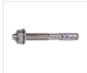
АНКЕР FIX II (НЕ СОБРАННЫЙ)

Материал сталь Покрытие цинк жёлтый Модель TGS (марка) Область применения для строительства