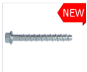
ВИНТ ПО БЕТОНУ

Материал сталь Покрытие цинк белый Модель (марка) LEM/ G Головка открытое кольцо