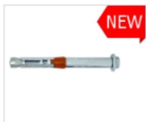
АНКЕР HDA-B С БОЛТОМ, ДЛЯ ВЫСОКИХ НАГРУЗОК

Материал сталь Покрытие цинк белый Головка шестигранная Область применения для окон и дверей, для фасадных работ, для инженерных коммуникаций, для строительства