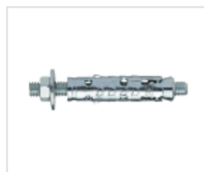
АНКЕР LE/D С КОЖУХОМ И ГАЙКОЙ