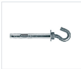
АНКЕР REDIBOLT C ОТКРЫТЫМ КОЛЬЦОМ

Материал сталь Покрытие цинк белый Модель REDIBOLT (марка) Головка открытое кольцо