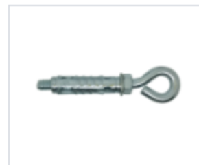
АНКЕР LEM/O С КОЖУХОМ И КОЛЬЦОМ

Материал сталь Покрытие цинк белый Модель (марка) LEM Тип резьбы метрическая