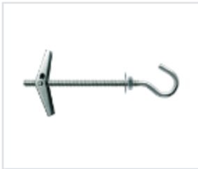
АНКЕР ETAf С ОТКРЫТЫМ КОЛЬЦОМ

Материал сталь Покрытие цинк белый Модель (марка) MOLLY Головка открытое кольцо