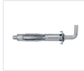
ДЮБЕЛЬ MOLLY С КРЮКОМ

Материал сталь Покрытие цинк белый Модель (марка) MOLLY Головка кольцо