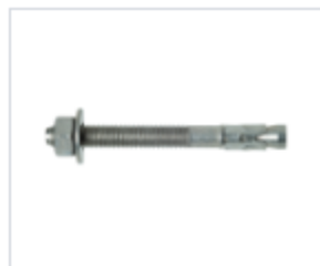
АНКЕР FIX Z

Область применения для окон и дверей, для строительства