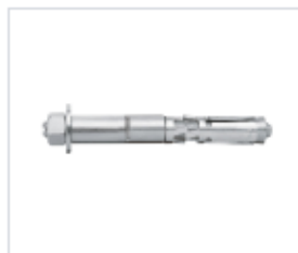
АНКЕР TRIGA Z C ГАЙКОЙ

Материал сталь Покрытие цинк белый Модель TRIGA Z (марка) Головка шестигранная