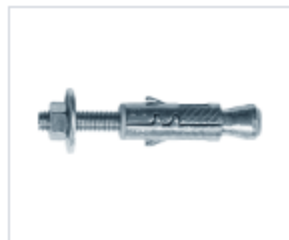
АНКЕР EFPM/D С ГАЙКОЙ