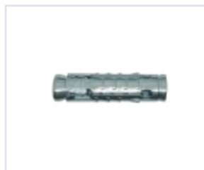
АНКЕР LEM С КОЖУХОМ

Материал нержавеющая сталь A4 Модель (марка) FIX Z Тип резьбы метрическая Группа крепежа нержавеющий крепёж