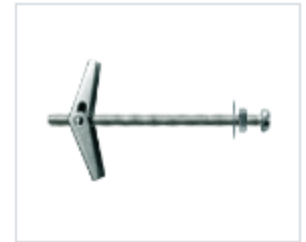
АНКЕР ETAf С ВИНТОМ

Материал сталь Покрытие цинк белый Модель ETAf (марка) Тип резьбы метрическая