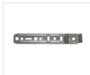
АНКЕРНАЯ ПЛАСТИНА С ПОВОРОТНЫМ УЗЛОМ