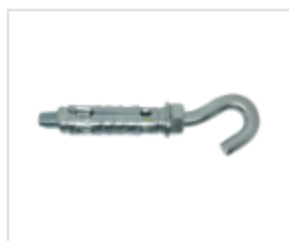
АНКЕР LEM/O С КОЖУХОМ И ОТКРЫТЫМ КОЛЬЦОМ

Материал сталь Покрытие цинк белый Модель (марка) LEM/ O Головка кольцо