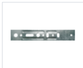
АНКЕРНАЯ ПЛАСТИНА БЕЗ ПОВОРОТНОГО УЗЛА