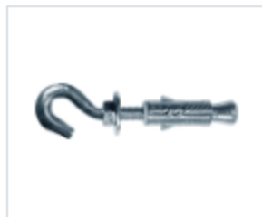
АНКЕР EFPM/G С КРЮКОМ