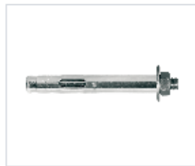
АНКЕР REDIBOLT C ГАЙКОЙ

Материал сталь Покрытие цинк белый Модель REDIBOLT (марка) Головка открытое кольцо