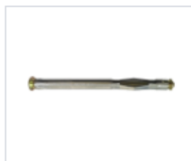
АНКЕР TFC MOLLY

Материал сталь Покрытие цинк жёлтый Модель TFC (марка) Шлиц крестообразный (PZ)