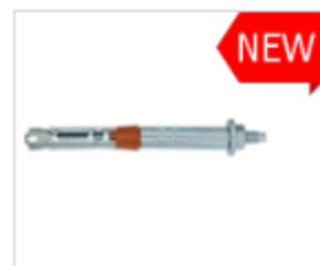
АНКЕР HDA-N С ГАЙКОЙ, ДЛЯ ВЫСОКИХ НАГРУЗОК

Материал сталь Покрытие цинк белый Модель (марка) HDA-B Головка шестигранная