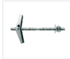
АНКЕР ETAf С ГАЙКОЙ

Материал сталь Покрытие цинк белый Модель (марка) ETAf Головка кольцо