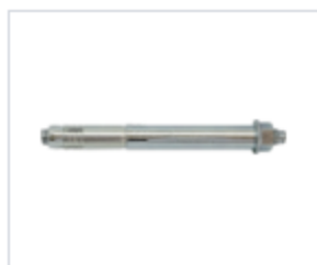
АНКЕР SLR ДВУХРАСПОРНЫЙ