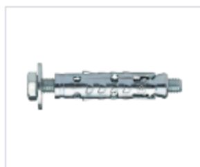
АНКЕР LE/B С КОЖУХОМ И ВИНТОМ