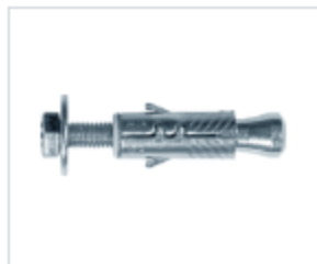
АНКЕР EFPM/B С ВИНТОМ