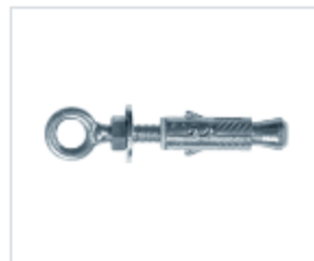
АНКЕР EFPM/O С КОЛЬЦОМ