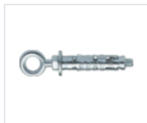
АНКЕР LE/O С КОЖУХОМ И КОЛЬЦОМ