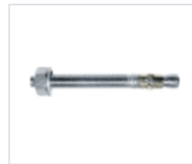
АНКЕР ETKD C НЕРЖАВЕЮЩЕЙ ЮБКЕЙ

Материал сталь Покрытие цинк белый Модель ETKD (марка) Тип резьбы метрическая