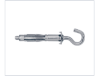
ДЮБЕЛЬ MOLLY С ОТКРЫТЫМ КОЛЬЦОМ

Материал сталь Покрытие цинк белый Модель (марка) MOLLY Головка крюк