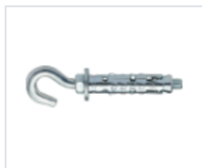
АНКЕР LE/G С КОЖУХОМ И КРЮКОМ